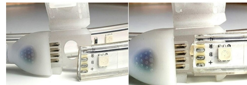
revisa la polaridad