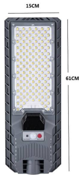
DISTRIBUCIÓN DE LA INTENSIDAD LUMÍNICA