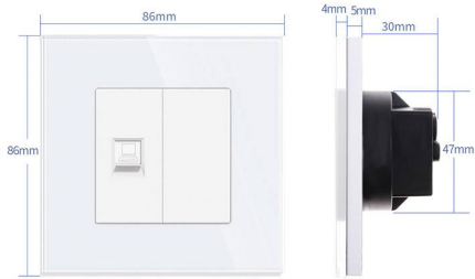
The wiring diagram of COM Socket