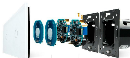
Luxury crystal Glass panel Touch screen board Electronic chipset Flame retardant bottom base

Perceive the essence through the appearance