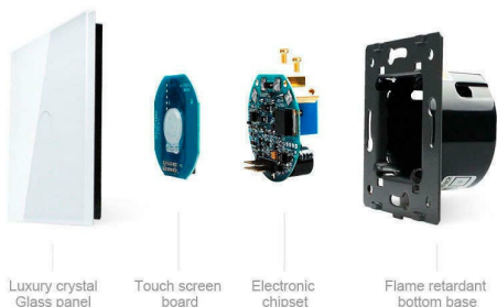
Luxury crystal Glass panel Touch screen board Electronic chipset Flame retardant bottom base

Perceiva the essence through the appearance