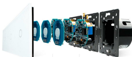
Luxury crystal Glass panel

Perceive the essence through the appearance